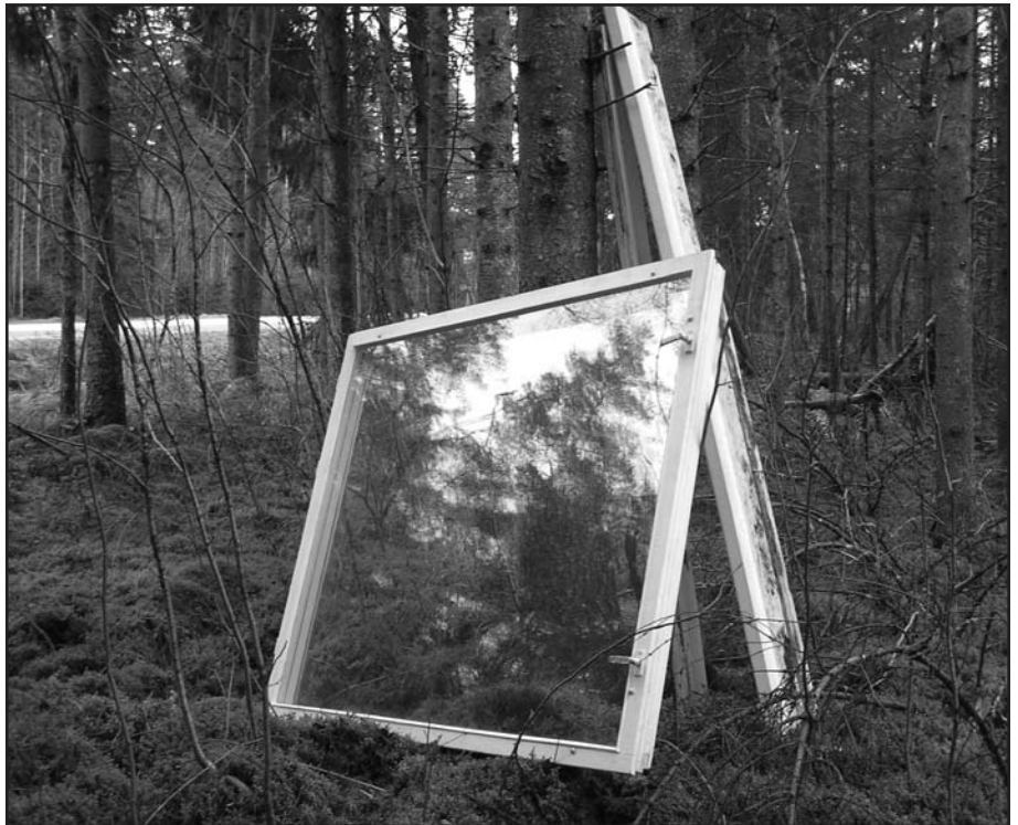
Niisugune vaade aknast - nii otseses kui kaudes mõttes - peab kaduma.

Kuhu kaovad vana hambahari, päevinäinud kummikud, katkised kindad, jalg-