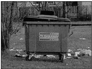
Linnavolikogu hakkab esmaspäeval purema jäätmekäitluse pätklit. Lk 3