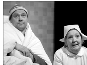
Oscar ja Roosamaama tulevad Rakverest Elvasse. Lk 5