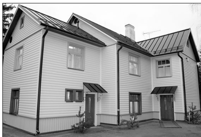
Legomajale sarnanev Peedu lasteaiahoone püüab pilku roheliste, kollaste, punaste ja siniste aknaraamidega.