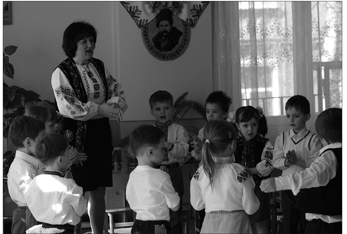
Väikesed esinejad lasteaias