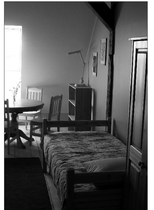
Nurgake õpilaskodus