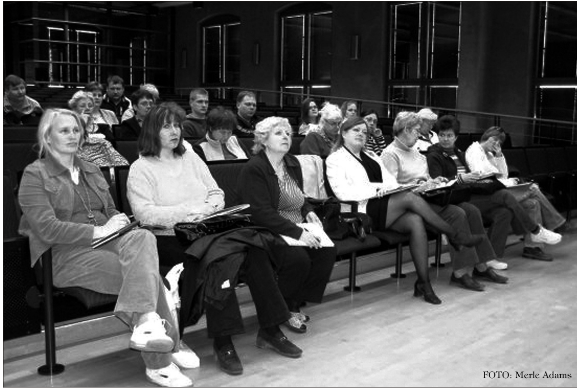
Reisiseltskond kuulab soomlaste juttu projektidest ja koostööst.