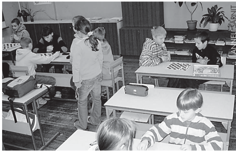
Päeva lõpetas kabevõistlus

panna. Lõpuks jaotati õpilased veelikord rühmadesse, anti kätte hunnik paberit, käärid ja liim ning tuli koostööd tehes valmis meisterdada võimalikult kõrge torn. Ehitudes