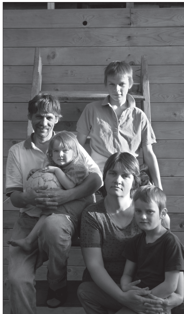
PEEDOSAARÕ KAISA PILT

Kodotoetus avitas Malleusõ perrel terve maja kõrda saia.