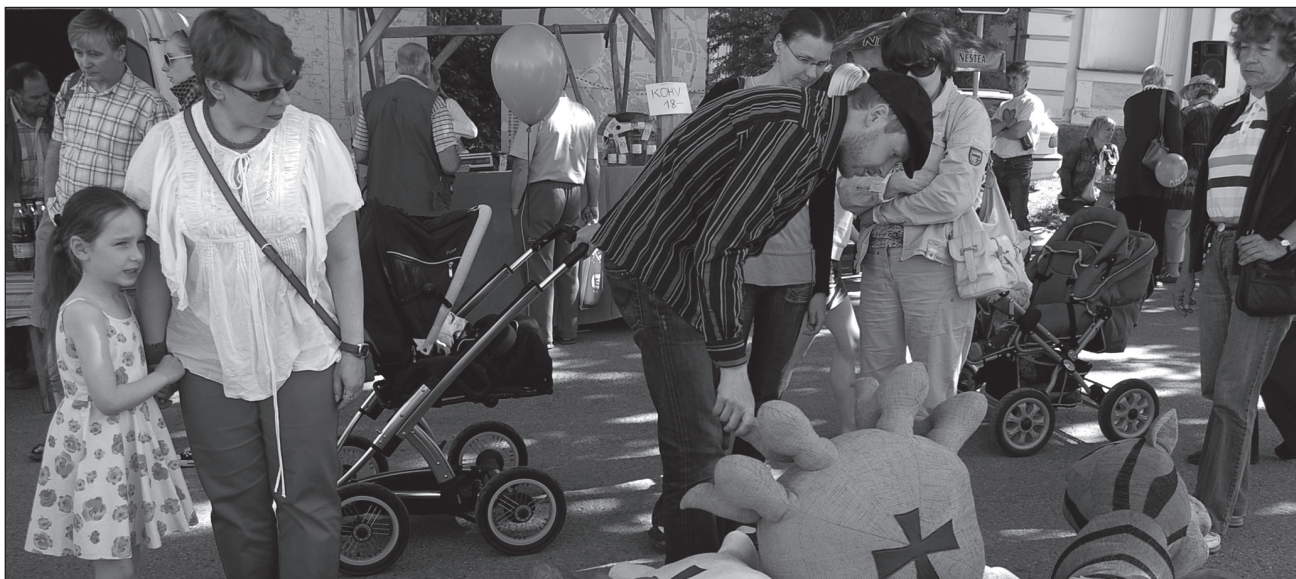
Kapi Kärdi tettü, istmisõs mõtõldu pehme eläjä miildüse rahvalõ: mäanest kodo osta, uurva tõisi siän lõõdsamiis