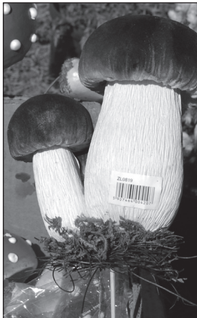
Võlss-seene: mõni üt' «andsak!», mõni «njummi!»