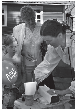
Nii Võro ku Põlva laadu pääl lätõ häste kaubas kõik, miä süvvä kõlva: esitettü leib huulmada tuust, et massõ 60 kruuni (Võrol), suidsuliha, seto kali ja olu (Põlvan).