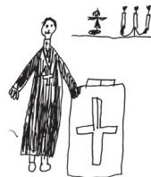
Joonist SAARÕ HIPPI

Kaeq egä kolmapäävä vahtsit Jussi-multikit: www.lastekas.ee → Jussi multikad → multikaq võro keelen!