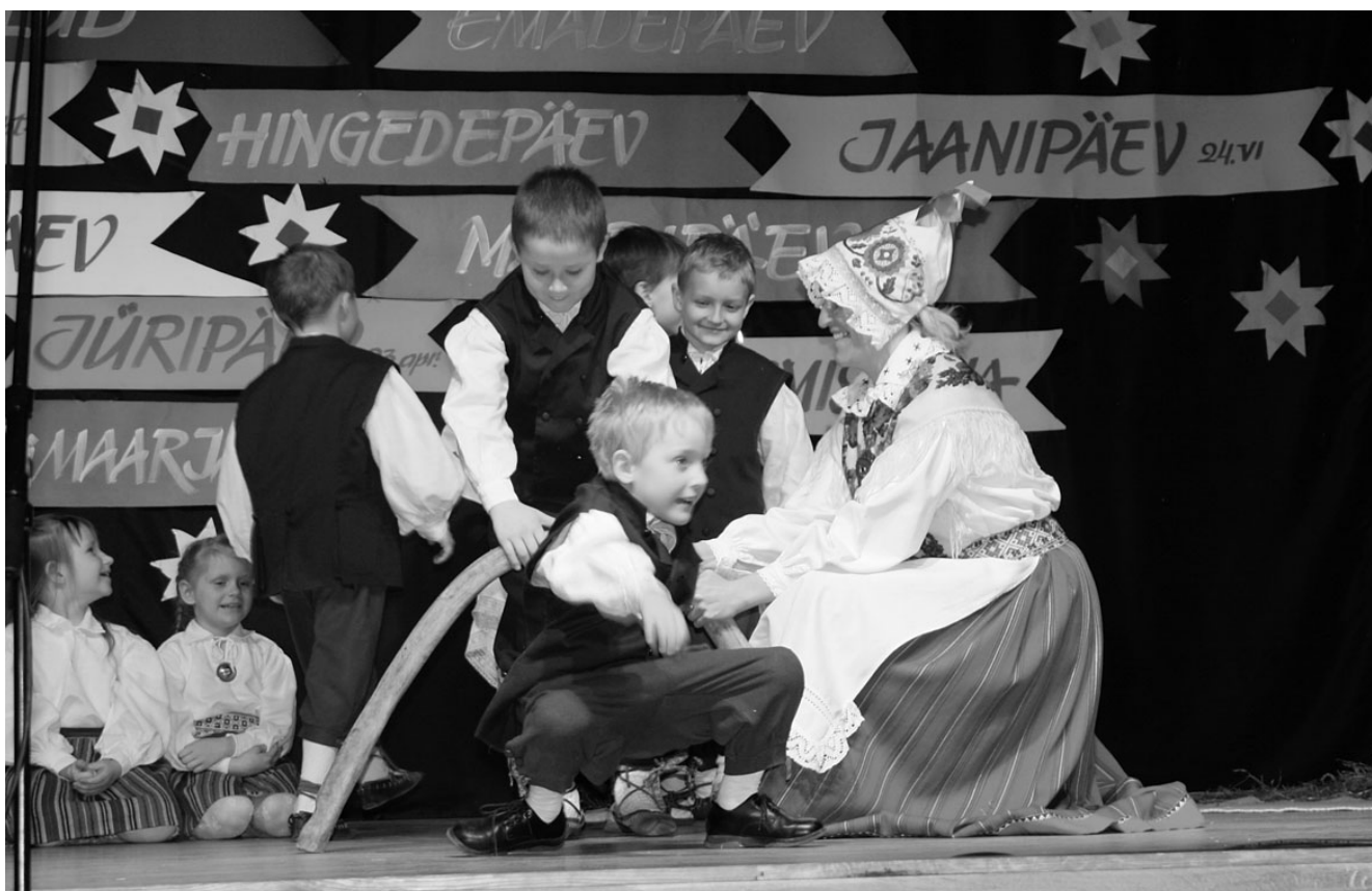
Konguta lasteaia lapsed lustisid pärimuspäeval vanarahva jõuluagseid mängides.