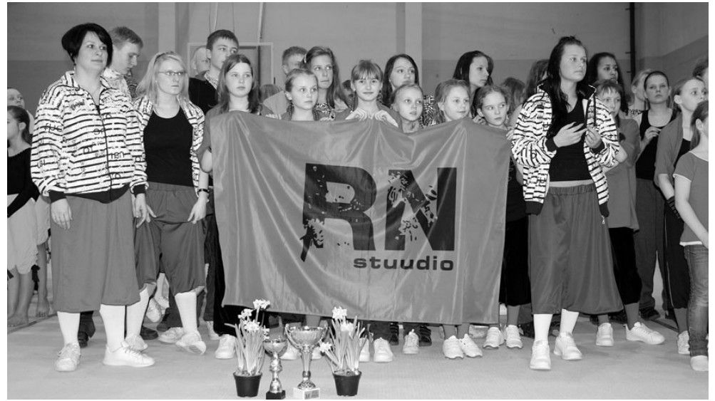
RN Stuudio tuli SK Airi korraldatud võimlamisfestivalil laureaadiks.

sid jõudu juunioride väike rühm (algajad), kes saavutas Eesti Reitingu võistlustel algajate seas esikoha, ja vanema vanuseastme noormehe 2. koha.