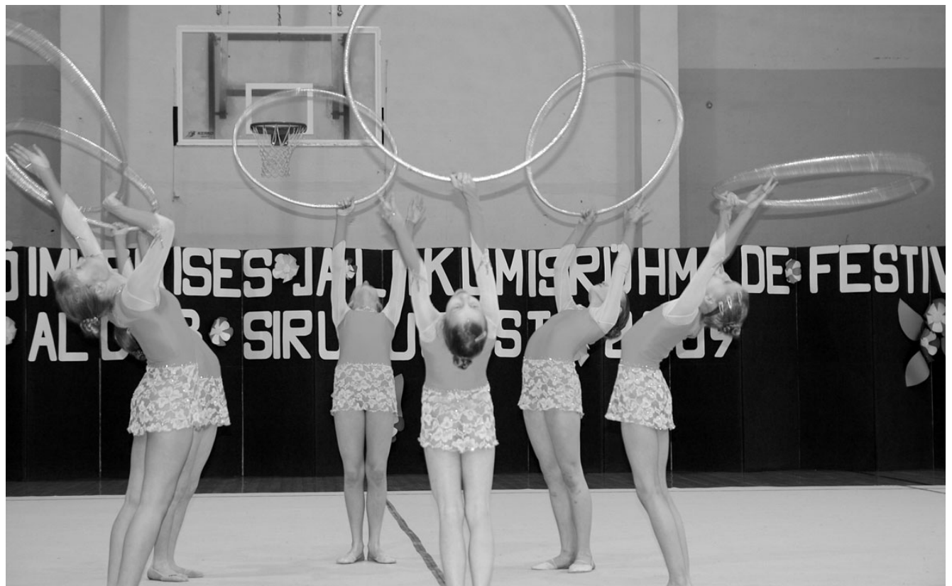
SK Airi võimlemisrühm Kullaketrajad võitis laste B võistlusklassis Elva meistri tiitli ning tuli kolmandaks nii vaba- kui vahendikavas.