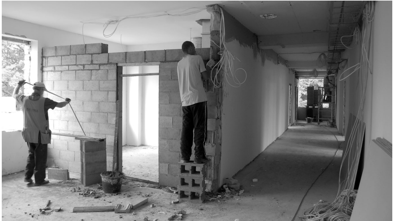
Rõngu koolihoones käivad enne kooli algust veel hoogsalt ehitustööd. Esimesed üheksa klassiruumi peaksid õppetööks saama 1. oktoobriks.

2. Nõo põhikool eraldi toimiva koolina tekkis 15 aastat tagasi ja seetõttu on algav õppeaasta meie jaoks juubelihõnguline. Selle aasta tähtsamateks märksõnadeks oleks karjäär, koostöö ja rahvus. Uuest õppeaastast oleme koostöös Elukestva Õppe Arendamise Sihtasutusega Innove tööle rakendanud karjäärikoordinaatori, kelle ülesanneteks on karjääriõppe koordineerimine ja info vahendamine noortele. Peame oluliseks, et noored saavad juba algklassides ülevaate töömaa-