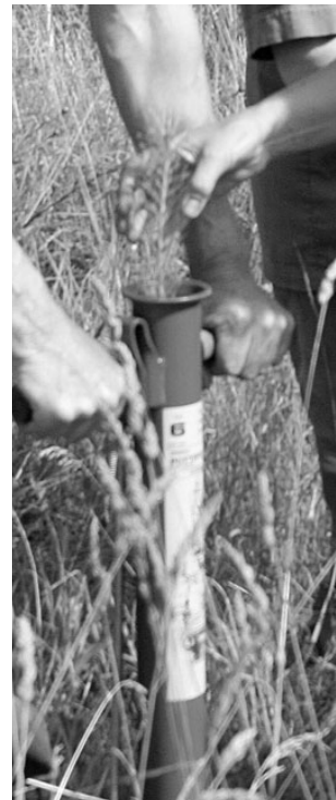
Väike männitaim pistetakse torusse.

Mullapallikestega potitaimi ei istutata labidameetodil, vaid selleks kasutatakse spetsiaalset istutustoru, mida on füüsiliselt kerge ja mugav kasutada ning mille jõudlus on labidaga istutamisest vähemalt kaks korda kiirem.