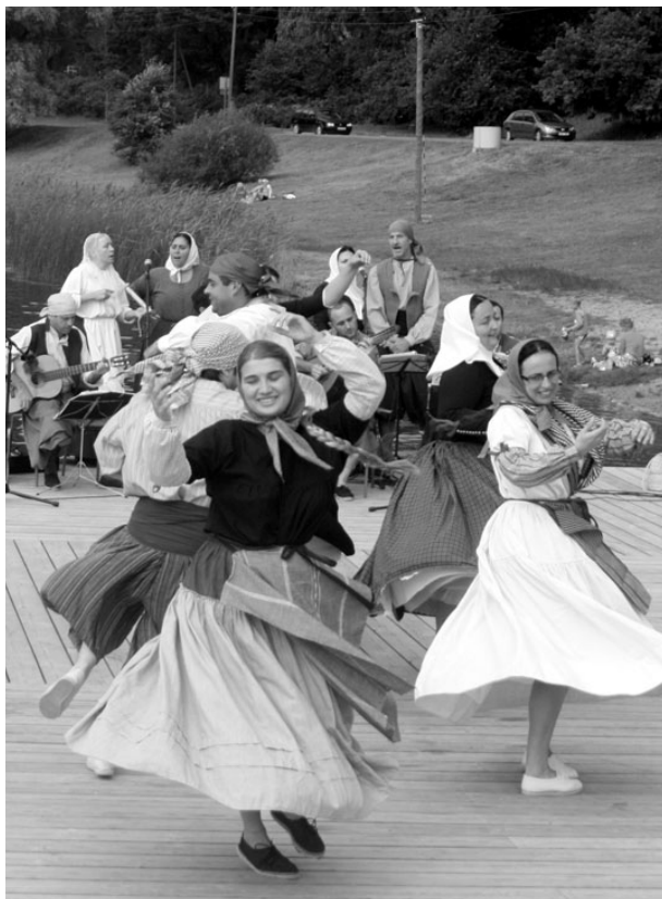
Folklooriansambel Estol de Tramuntana Verevi rannas tantsuhoos.

Verevi rannast sõidutas buss Mallorca rahvamuusikud esinema Randu. Nädalalõpu veedavad nad aga Märjamaa folgi-päevadel. EPP