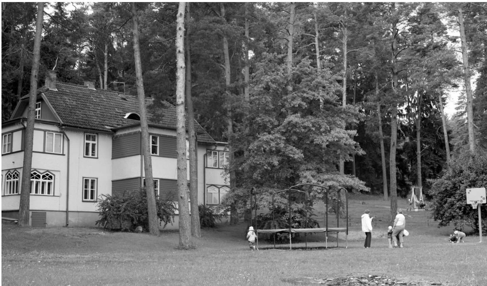
2011. aasta lõpuks valmivad kaks peremaja peavad sobima kinnismälestisena muinsuskaitse all oleva Afanasjevi suvila arhitektuuriga. Nii kerib paari aasta pärast Verevi kaldale terve piparkoogimajade küla.