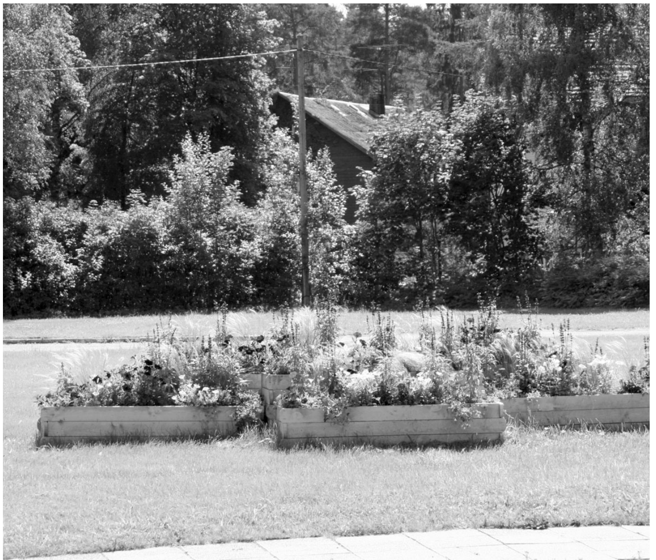
Asjatundja silmale mõjuvad puust või kivist lillekastid murus võõrkehana, sest kujunenud arusaamade kohaselt ei sobi kastid sinna, kuhu saaks rajada peenraid.