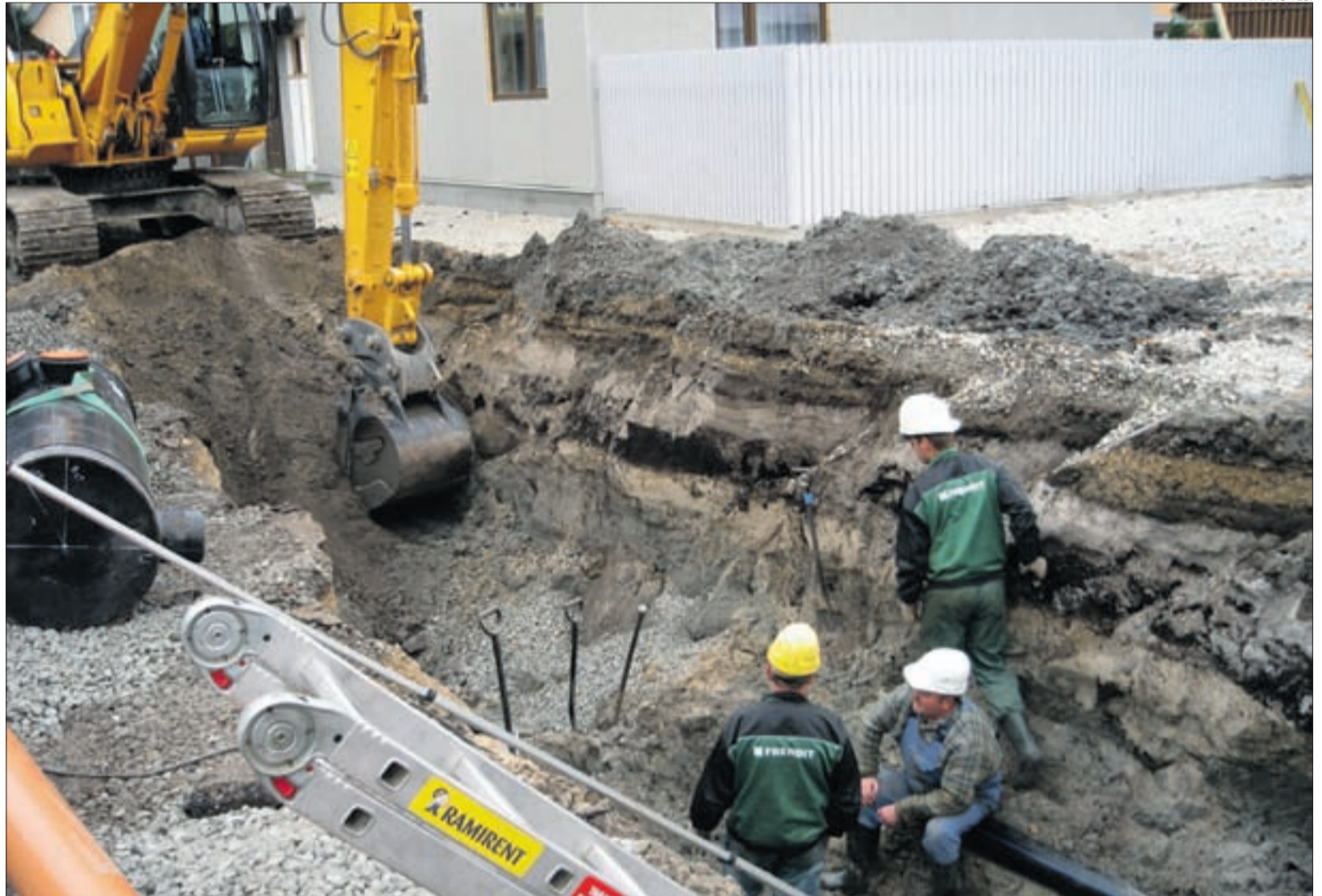
Torutööd Pärnus Luha tänaval.

Pärnumaal plaanivad kaks valda liitumist