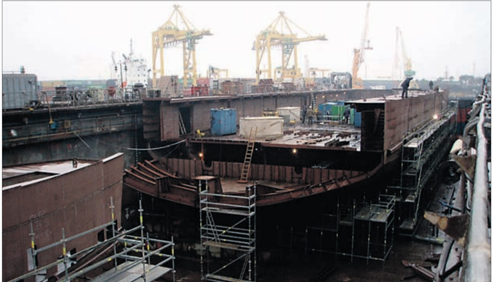
Saaremaa saab uued laevad.

Võime olla rahul, et peretoetuste maksmise põhimõtteid ja vanemapalka kärped ei puuduta. Lastega perede kindlustunne on ebakindlatel aegadel kõige olulisem. Ka pensionitõus tuleb, tõsi, veidi väiksem kui algselt kavandatud. Kokkuhoid avalikus sektoris on kindlasti nii vajalik kui ka võimalik. Lisaks on olemas kava, mida edasi teha, kuidas majandus ümber korraldada, kriisist väljuda. Selle elluviimisel saavad kaasa lüüa kõik.