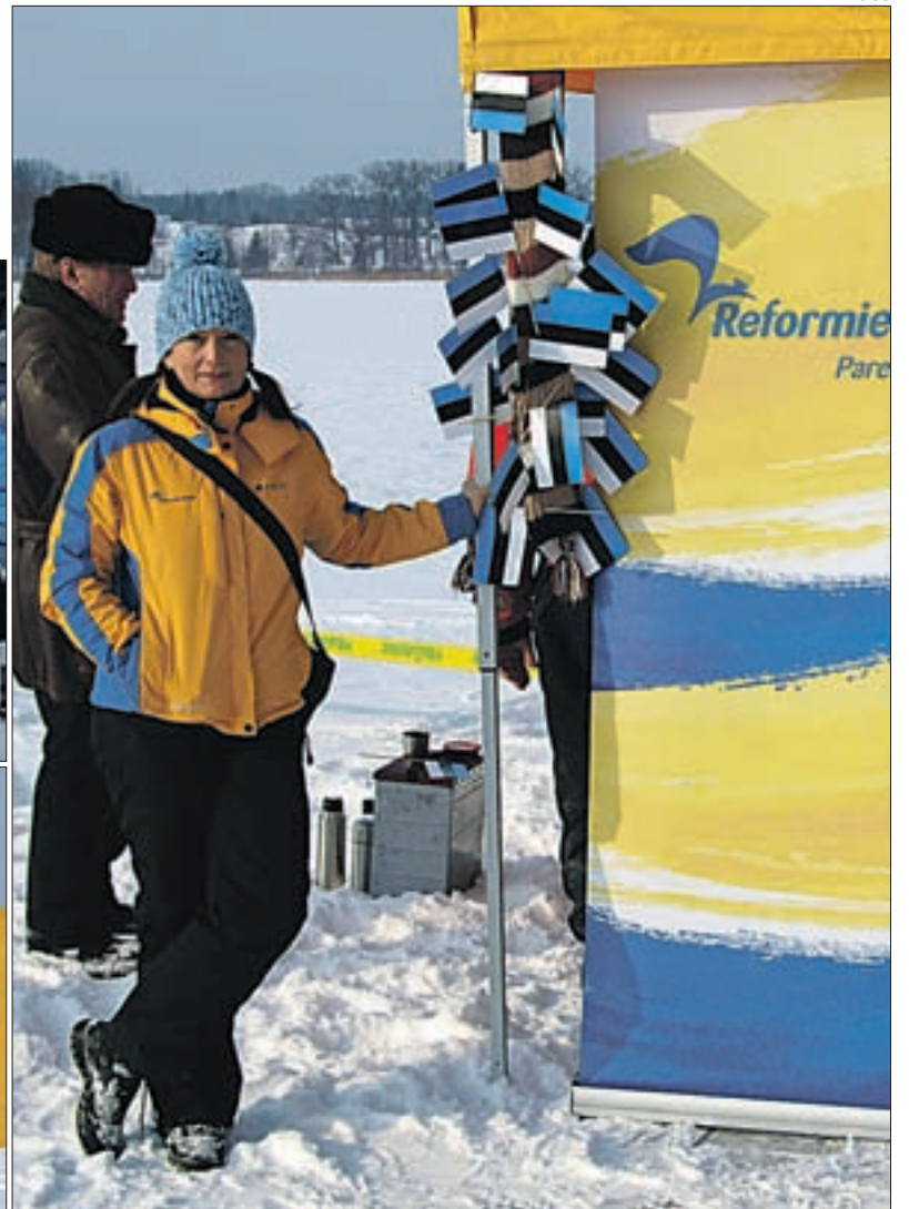
Kohaloleku märgiks püstitati järvele staap. Pildil loo autor Aire Mäesalu.