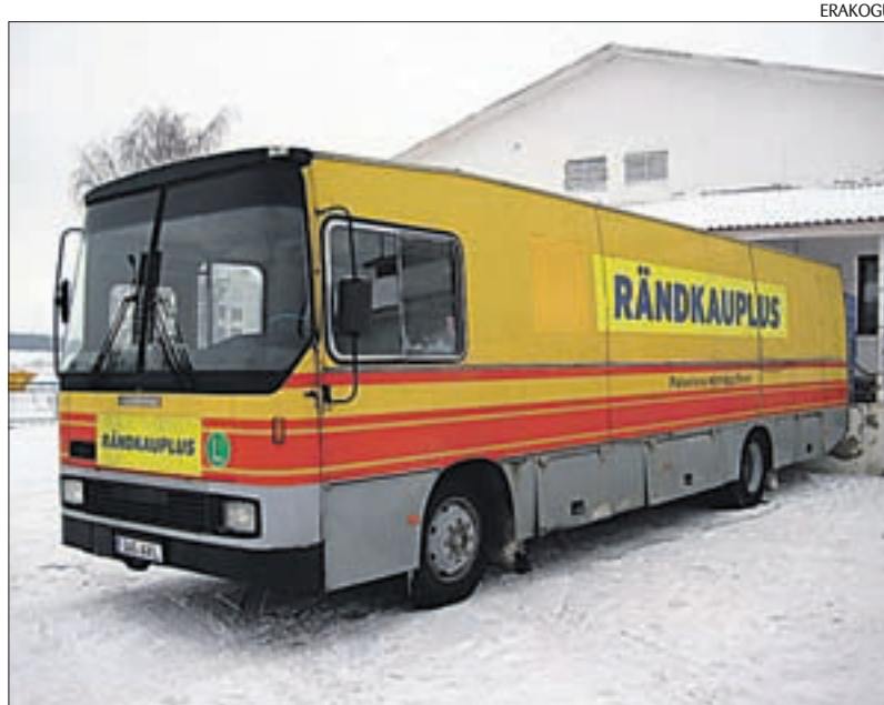
Autokauplust külastavad usinalt need ostjad, kel iga päev linna asja pole.

kõiki kaupu, mis eluks vajalikud. Värske leib, sai ja piim on alati olemas. „Kaupluses pole olemas seda valikut, mis on marketites, kuid aastatega on