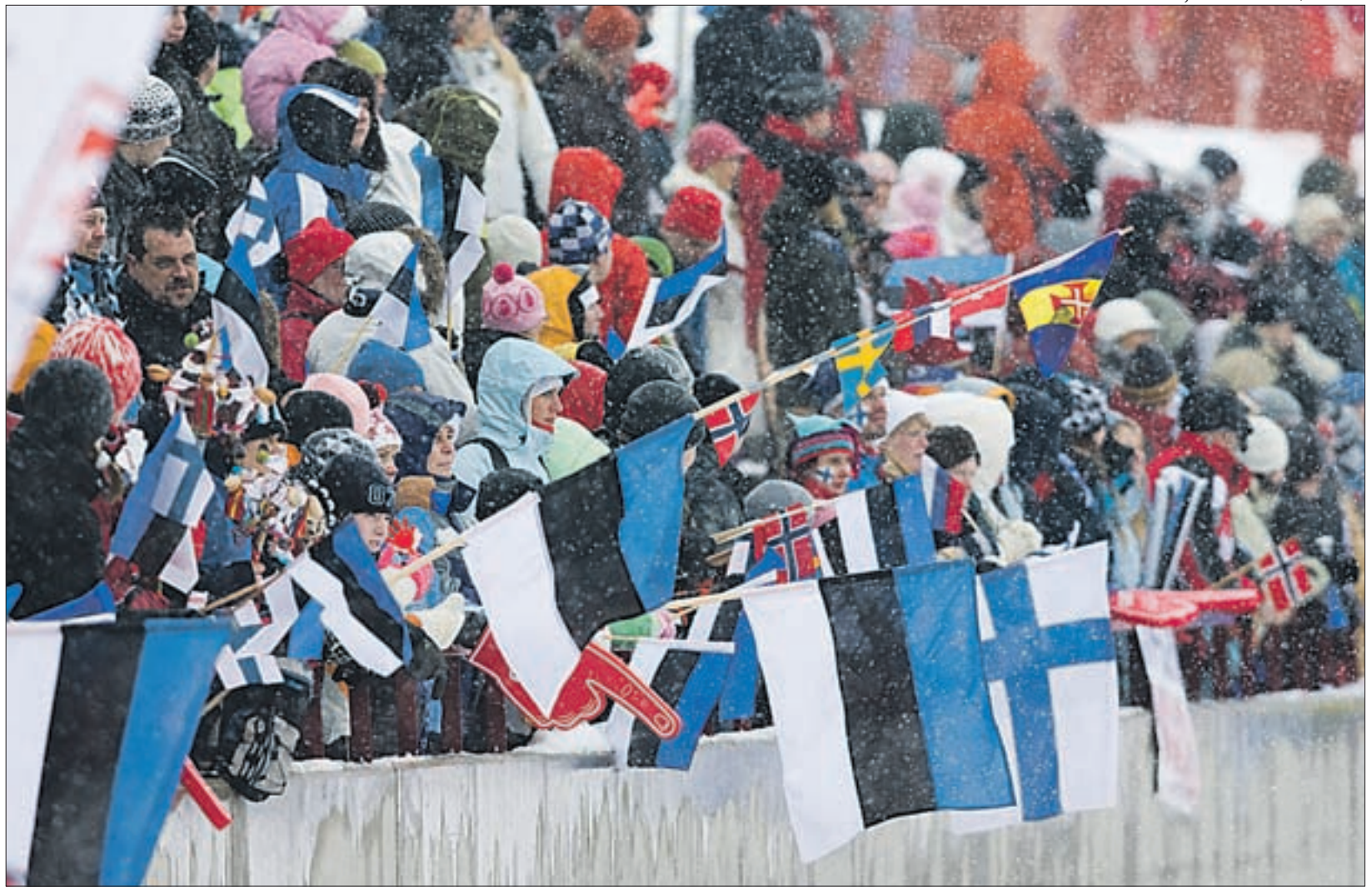
MK etapp murdmaasuusatamises on üks talvise Otepää publikumagneteid.

Keeruliste aegade tähtsaim õppetund on, et need panevad mõtlema, lahendusi otsima. Kerget valikuid enam ei ole. Kaasatriivimise võimalus puudub. Algaval kevadel ja ees ootaval suvel tuleb meil kokku hoida nii raha säästmise mõttes, kui üksteisele küünarnukitunnit pakudes. Siis on lootust, et uuel sügisel oleme üheskoos uuele edule lähemal kui praegu.