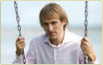
Riigikogu liige Lauri Luik