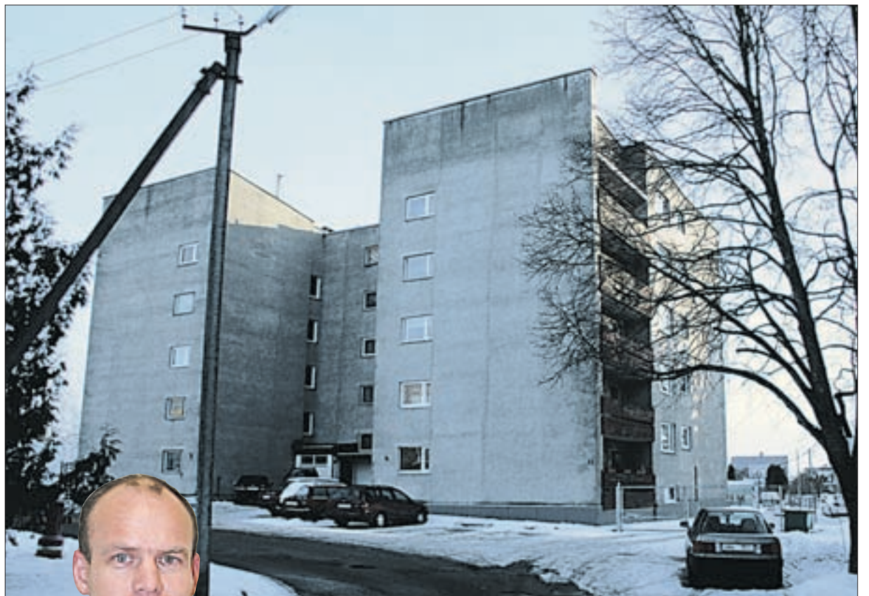
Kivi 4 elamust Jõgeval on saanud kodu.

Igal aastal on tehtud mõni suurem töö. 2002. aastal renoveeriti täieli- kult maja sissekäigud. 2003.-2006.