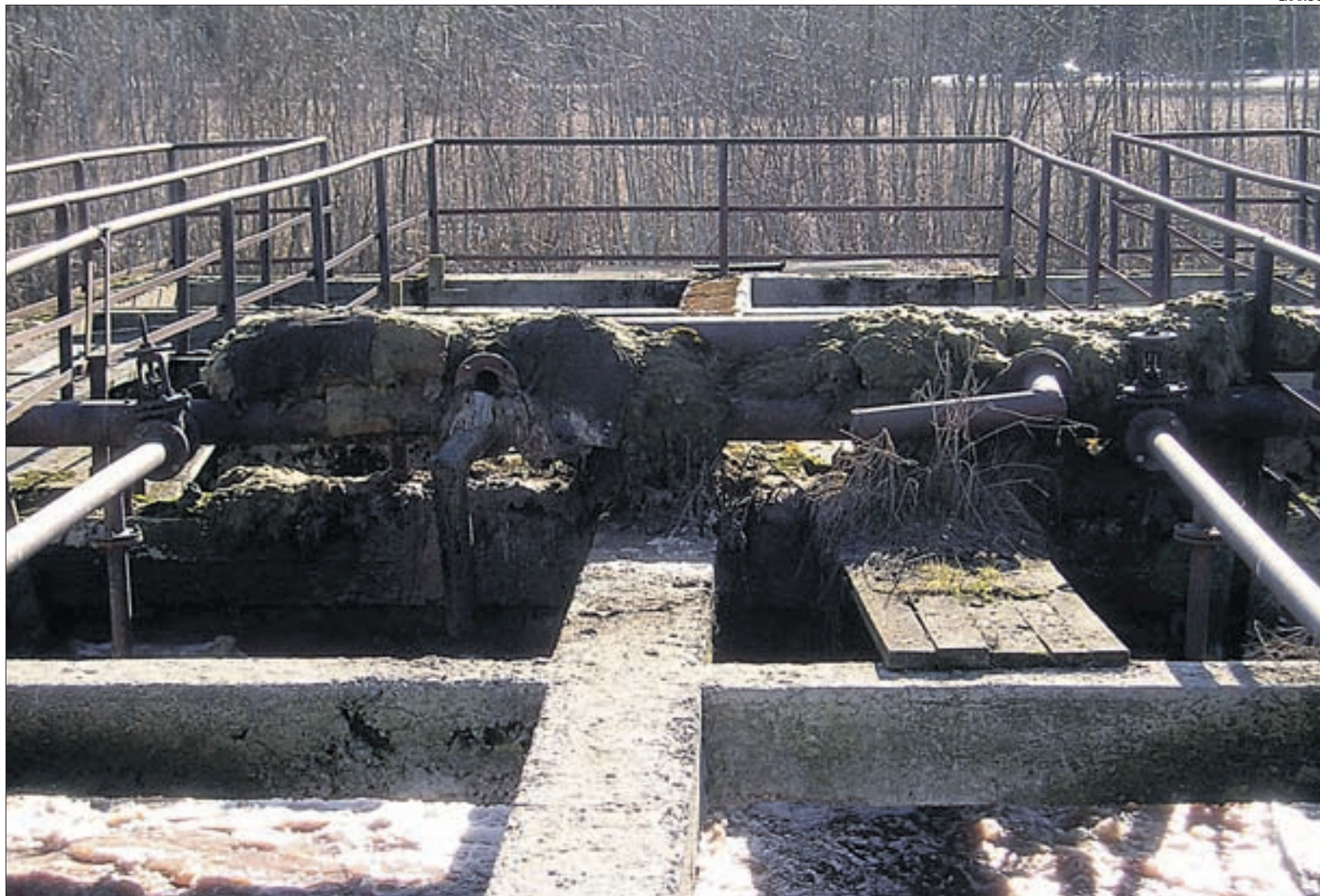
Veevärk tuleb korda teha.