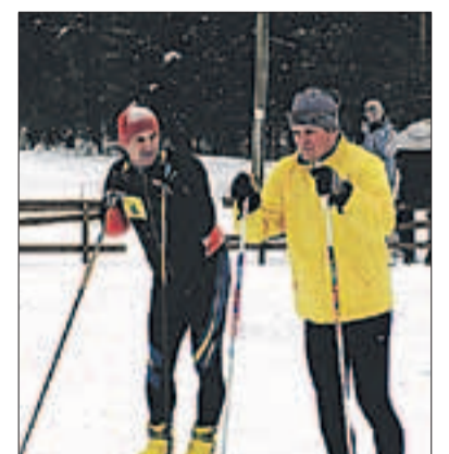
Suusahuvilised ootavad raja valmimist.

Paliveres saab olema valgustatud suusa- ja rollerirada koos sildadega, teenindus- ja majutusmaja, spordi-