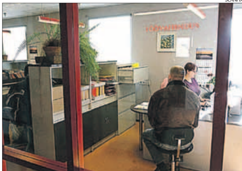
Tööst ilmajäämise korral tuleb ennast aegsasti tööturuametis arvele võtta.

Töö kaotamine on tavaliselt ootamatu ja tuleviku suhtes suurt ebakindlust tekitav olukord. Olles aga esimesest ehmatuses toibunud, on aeg end töötuna arvele võtta ja hakata otsima uusi väljakutseid. Viivitada ei maksa kas või seetõttu, et haigestumise korral peate oma ravikulude eest ise tasuma. Et tööturuametist abi saada, tuleks ennast töötuna või töötajana arvele võtta. Mõistlik on pöörduda sellesse tööturuameti osakonda, kus teil on kõige mugavam hakata käima igakuistel vastuvõttudel. Kindlasti tuleks mõelda sellele, et hüppeliselt kasvavad tööpuudus on tekitanud tööturuameti osakondades järjekorrad. Tavaliselt on nädala esimeses poole