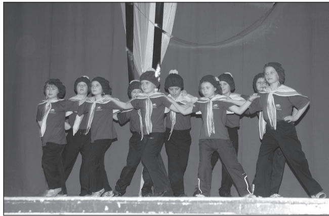
2c klass - kava "Madrused".