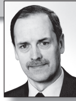
RENÉ VILJAT fotograaf