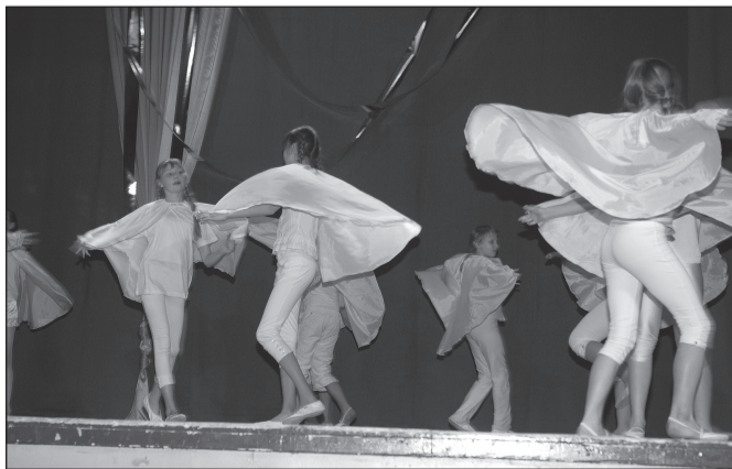
4c klass - kava "Fly".