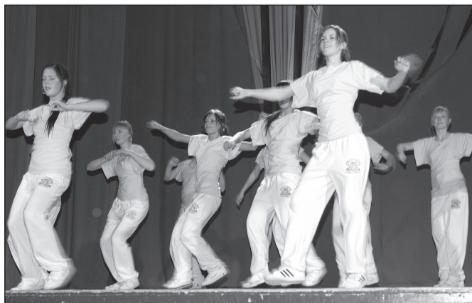
10b klass - kava "Mis on päris hea".