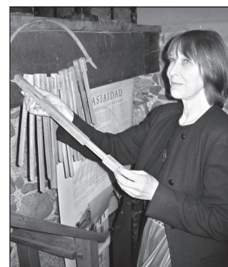
ALLASÕ TIIA PILT