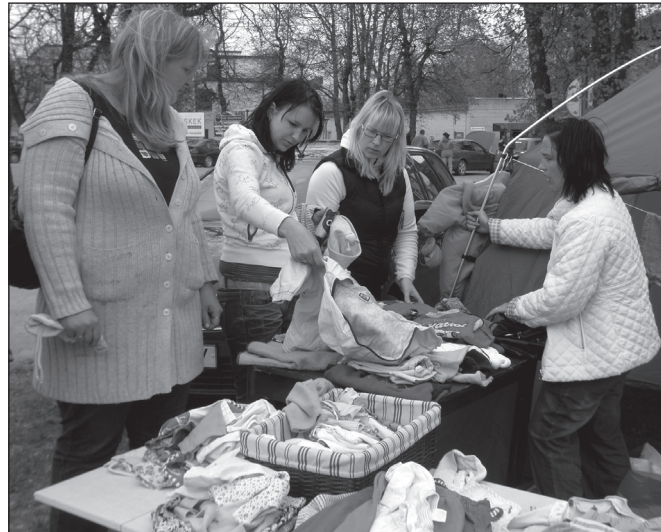
PEEDOSAARÖ KAISA PILT Jārgi Mari-Liis kaubōf taaskasutus-pāāvāl poiskōsō rōividōga.

Kōgō kallimb asi, midā tütrik mõi, olf 30 kruuni masva püksupaar.