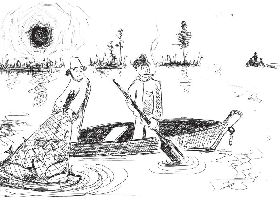
KOHA PRIIDU TSEHKENDÜS

Pilve lätsivä lakja, ilm valgõmbast ja lafko naksiva viih peris tandsu lüümä. Kas olõti trehvänü nägemä, kuis lafko umma pulma-