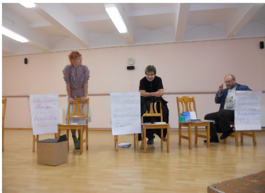
VÄÄRT ETTEVÕTMINE: Lugemisaastal jõudis kirjarahva tavapärase sügistuuri ka Alatskivile, kus seda kiitsid nii õpetajad kui õpilased.