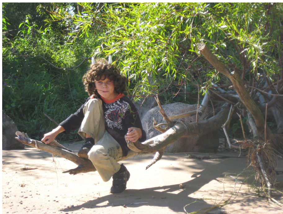
HUVITAV ETTEVÕTMINE: Oskar Lutsu värvikas raamatukangelane Nukitsamees aitas Kallastel noori lugejaid ühendada, harida ja arendada.

Kooskäimistel selgus, et Iti osatäitja tahab olla iga tüdruk, kuid Nukitsamehe veenmisega oli tükk tegemist. Kas see oli tingitud kohusetundlikust tekstiõppimise vajadusest suvisel koolivaheajal või karvusest sarvenukkide ees või hoopiski...?