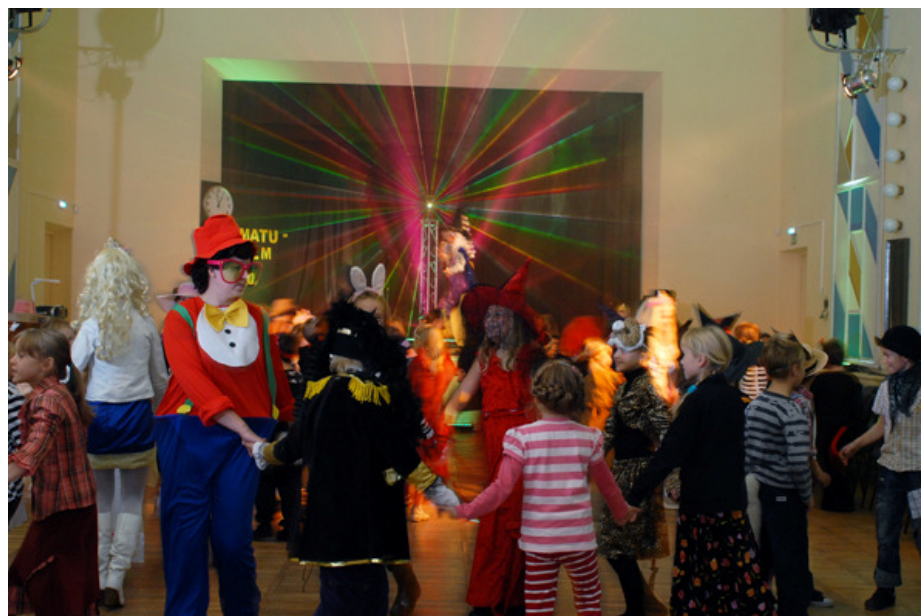
KIREV SELTSKOND NAUTIS VÄRVI JA VALGUSE MÄNGU: Väga hästi korraldatud raamatupeol kohtusid tegelased paljudest toredatest lasteraamatutest.

Tartu kunstigümnaasiumi algklasside näitering oli külas omaloomingulise luge-