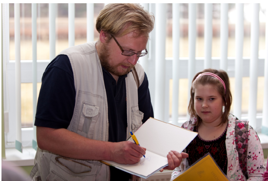
SÕNA SEOB: Ehkki valdav osa Contra loominguist ei ole sihitud otsejoones lastele ja noortele, suudab ta kergesti võita ka noorrahva südamed.